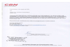
Scanner_20200831 (2).png 346 KB