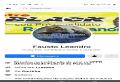
Foto_Motorista.jpg 69 KB

A segurança do processo eleitoral depende de você. Proteja suas informações.