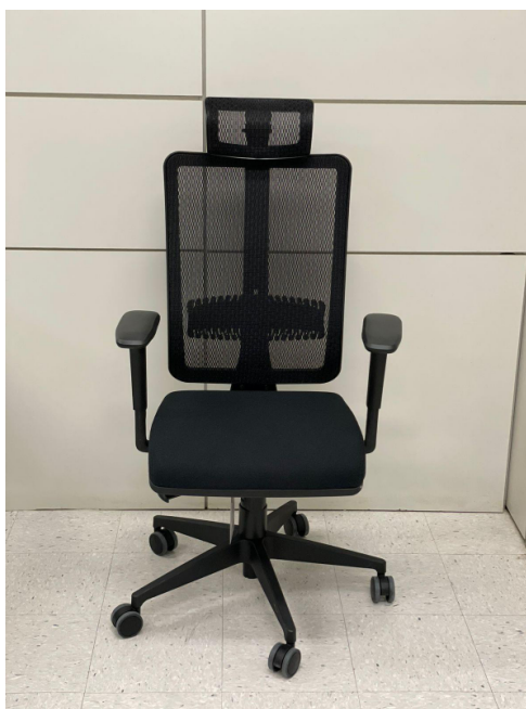
Figura ilustrativa – item 01

5.18.4.5. Marca e modelo de referência: Marca Tokplast – modelo 91F1-TL