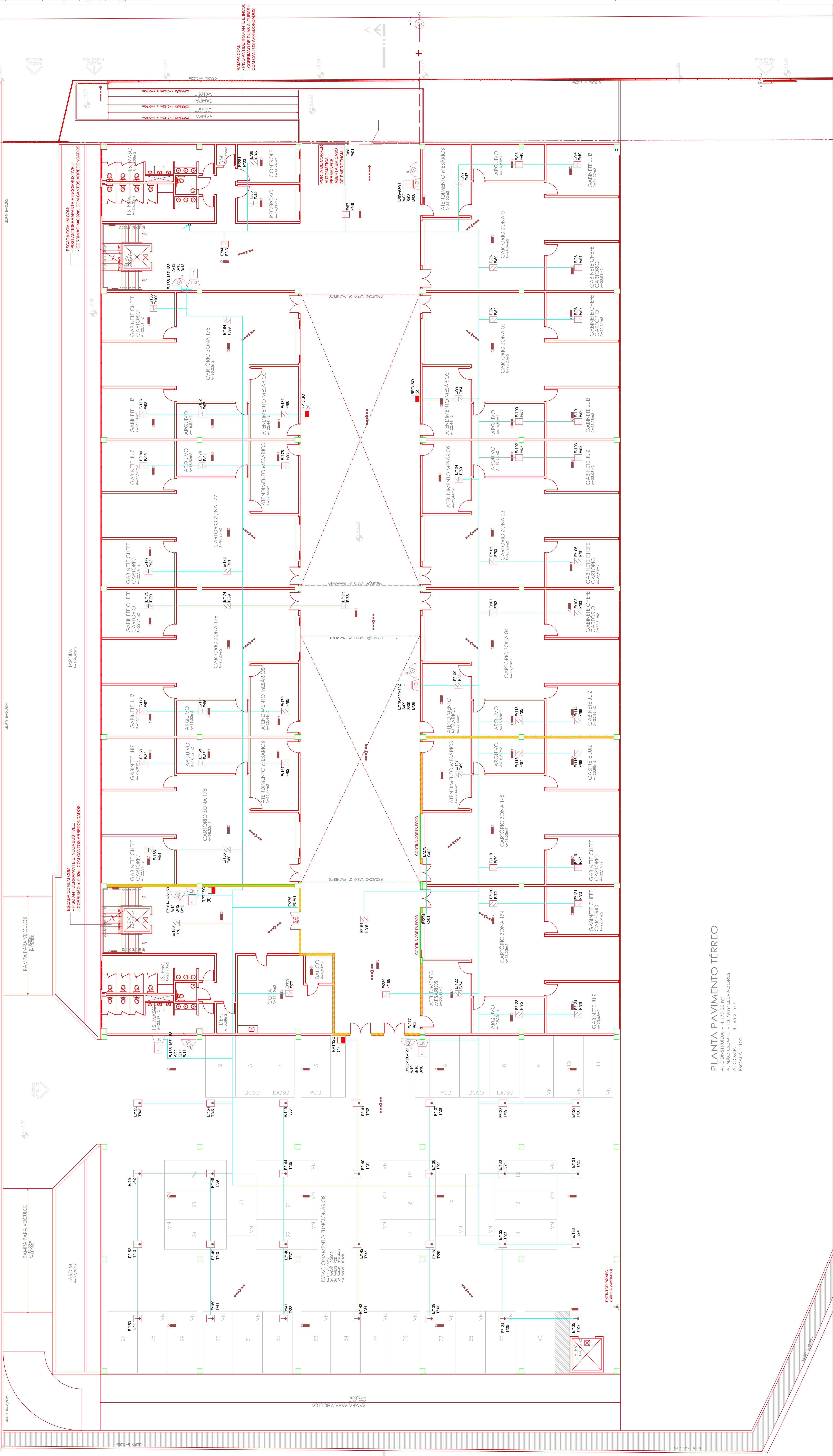
PLANTA PAVIMENTO TÉRREO A. CONSTRUIDA - 4.179,00 m² A. NÃO COMP. - 13,79 m² ELEVADORES A. COMP. - 4.165,21 m² ESCALA 1:100